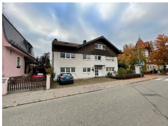
Bestandgebäude entlang der Luitpoldstraße im Plangebiet