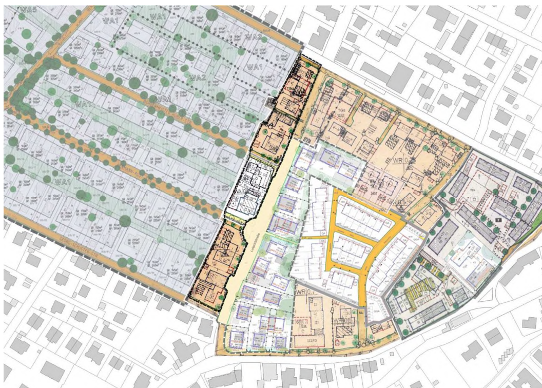
Rechtsverbindlicher Bebauungsplan Nr. 28 vom 27.06.1978 und diverse Änderungen sowie der westlich liegende Bebauungsplan Nr.27

Im Jahr 2004 wurde der Bebauungsplan Nr. 27 beschlossen, der westlich an das Planungsgebiet angrenzt. Dabei wurde das Maß der Bebauung über die Grundflächen bzw. Geschossflächen sowie über die Zahl der Vollgeschosse festgelegt sowie wichtige Grünstrukturen und Gartenbereiche gesichert.