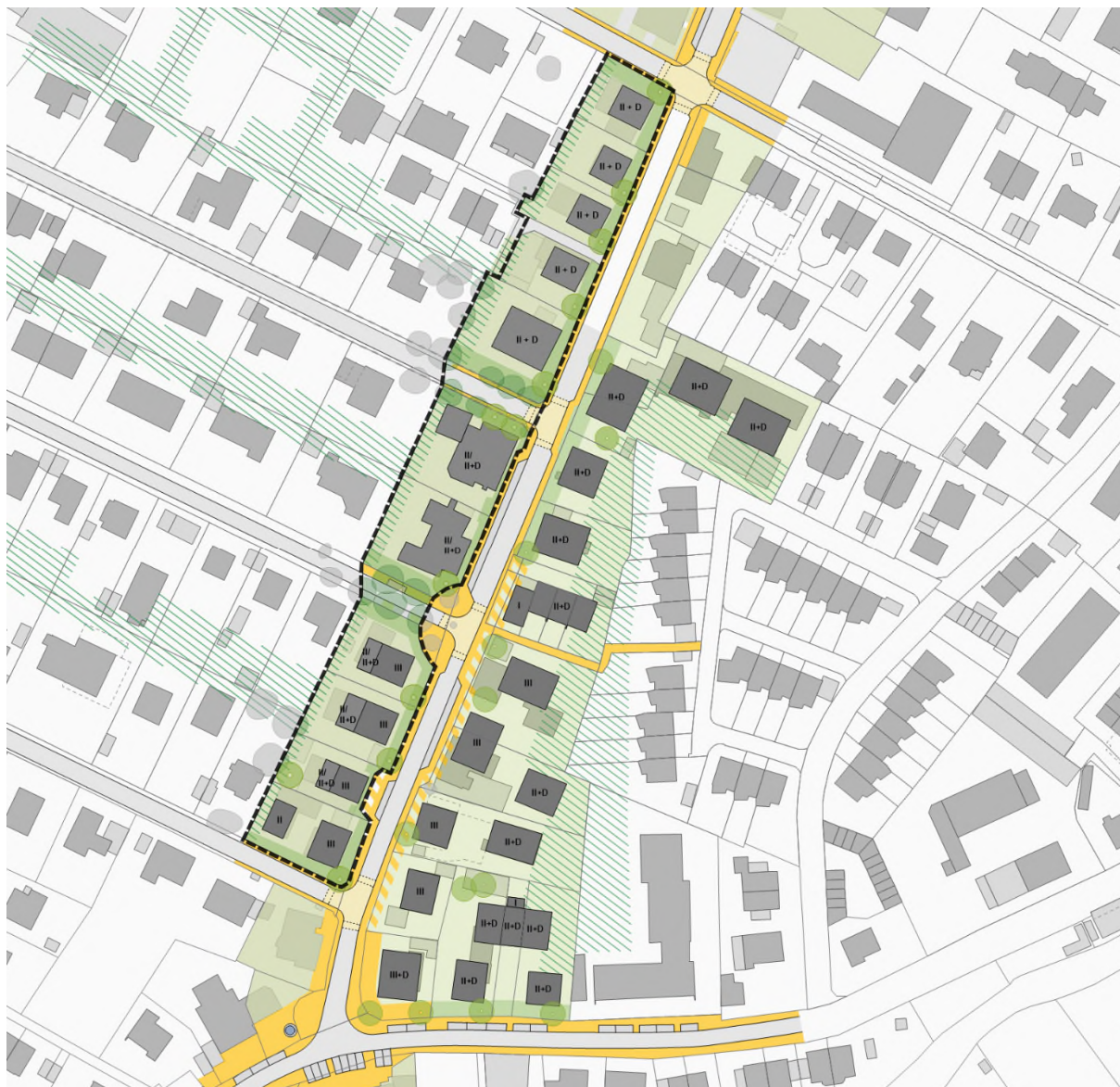
Städtebauliches Konzept zum Bebauungsplan mit gegenüberliegender Straßenseite

Die bestehende baurechtliche Situation lässt sich auf Grund der vielfältigen Änderungen des Bebauungsplans und auf Grund von Schwierigkeiten im Hinblick auf den Vollzug der bestehenden Festsetzungen nicht klar beschreiben. Mit dem neuen Konzept werden die ursprünglichen Ziele der Gemeinde weitergeführt, jedoch neu geordnet und im Rahmen der aktuellen rechtlichen Vorgaben klar bestimmt.