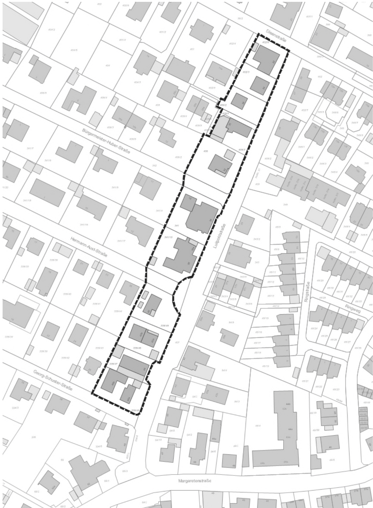
Flurkarte mit Geltungsbereich der Änderung